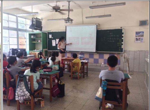
說明：學生瞭解口腔疾病的狀況