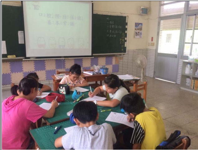
說明：指導學生瞭解口腔保健的基本常識