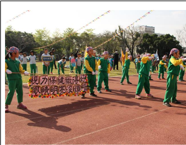
說明：運動會向社區民眾與家長進行視力保健 宣導