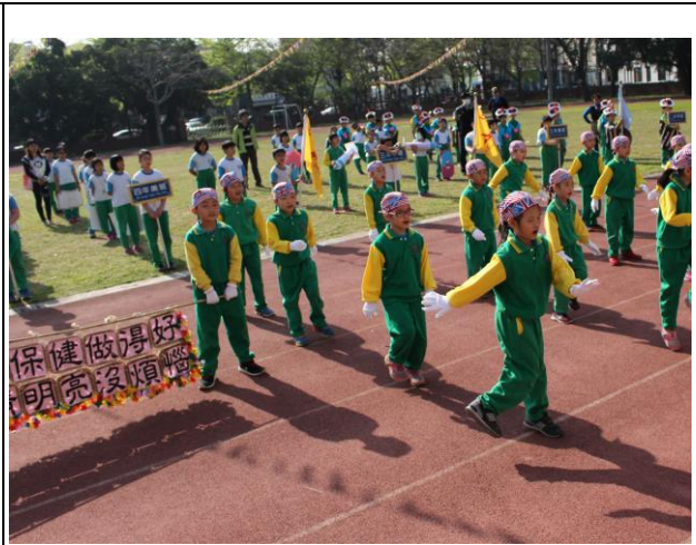
說明：運動會向社區民眾與家長進行視力保 健宣導