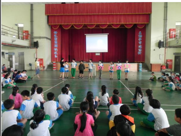
說明：學生朝會視力保健宣導