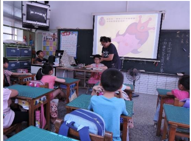
說明：指導正確寫字看書姿勢