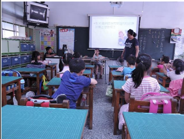
說明：看書時，眼睛與書本的適當距離示範