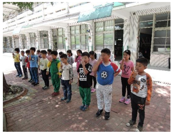
說明：下課時鼓勵學生到戶外活動，減輕眼球肌肉疲勞。