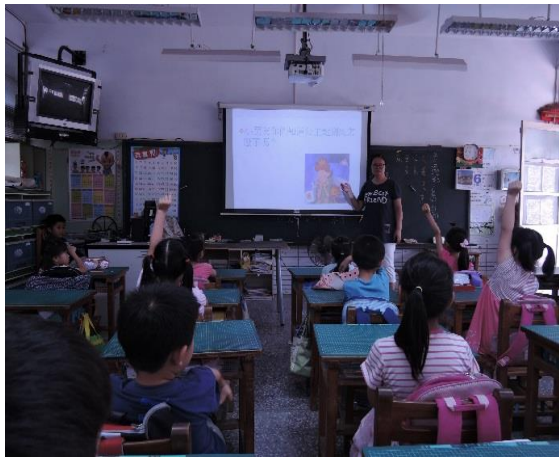
說明：班級視力保健教學問題討論