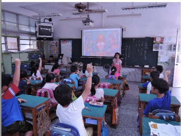
說明：班級視力保健教學-導讀繪本「眼鏡公 主」