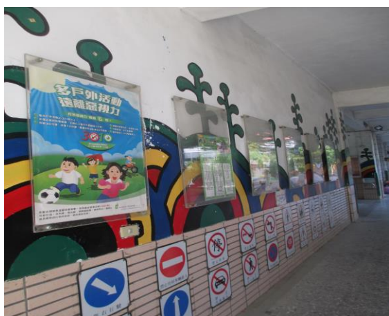
說明：佈告欄視力保健海報宣導