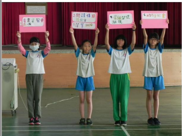
說明：學生朝會視力保健宣導