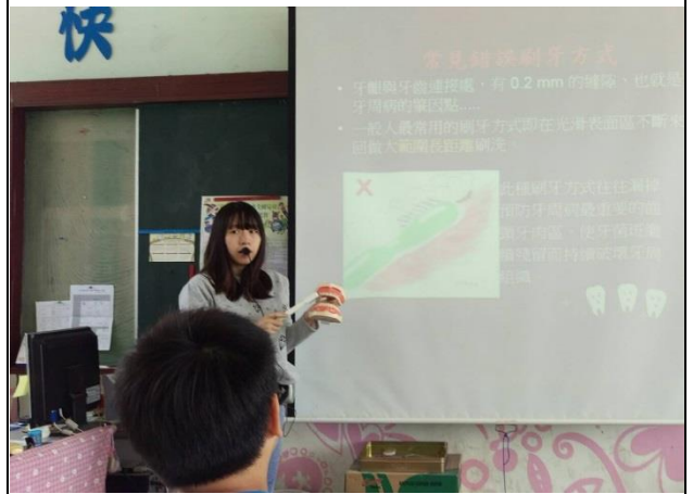
說明：指導學生如何刷牙