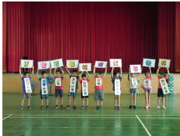
說明：學生朝會口腔保健宣導