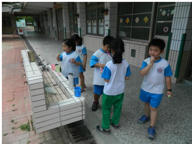
說明：午餐飯後播放潔牙歌提醒學生潔牙