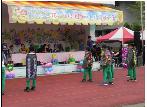
說明：運動會向社區民眾與家長進行口腔保 健宣導