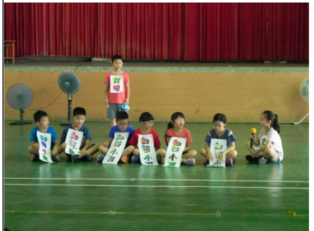
說明：學生朝會口腔短劇保健宣導