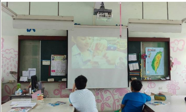
說明：學生觀看貝氏刷牙法影片