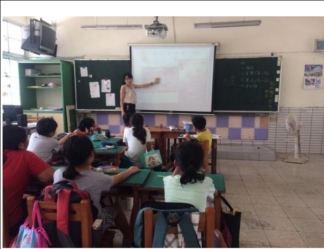
說明：班級口腔保健教學