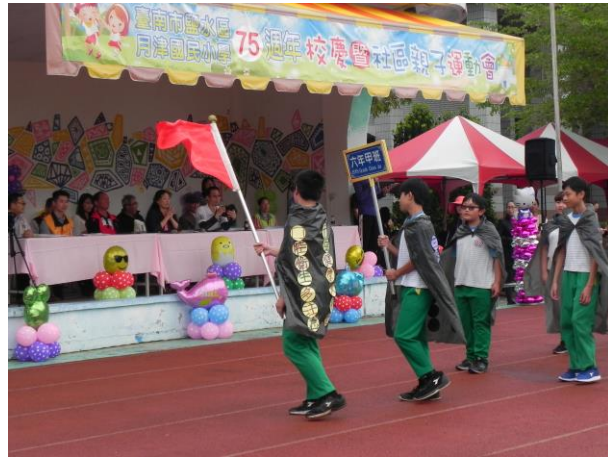
說明：運動會向社區民眾與家長進行口腔保健 宣導