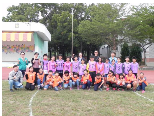
說明：樂樂棒比賽校長頒獎及合照