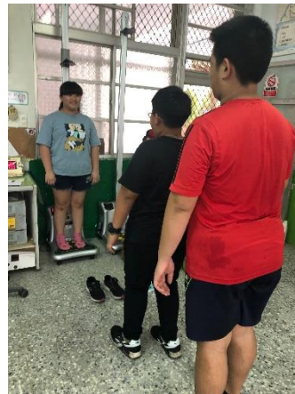
說明：學生自己量體重