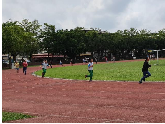
說明：學生參與健康活動