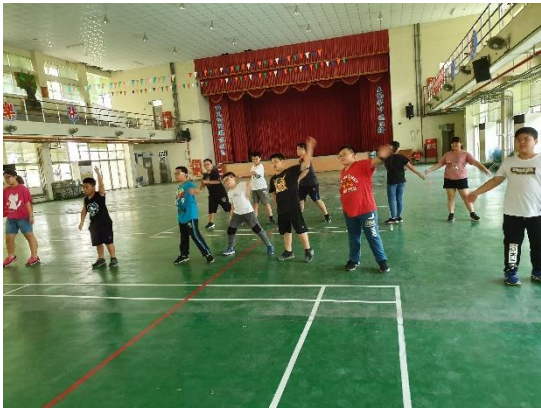
說明：學生參與健康活動