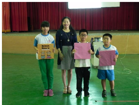
說明：健康體位最佳努力寶貝與校長合照並頒獎