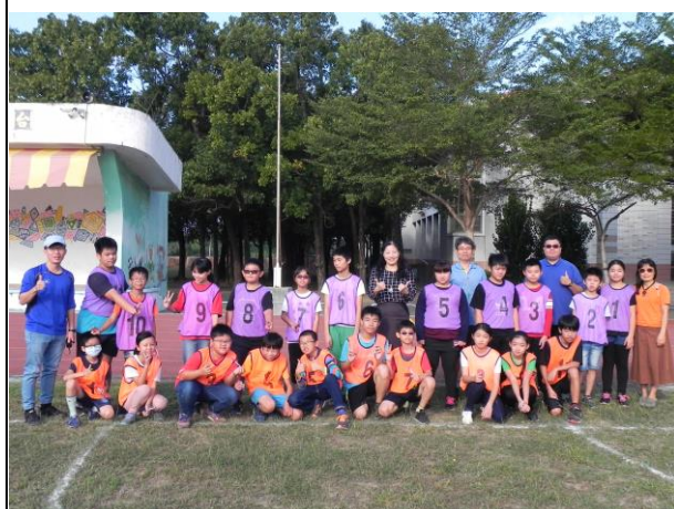
說明：樂樂棒比賽校長頒獎及合照