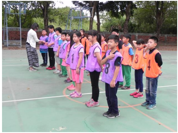
說明：躲避球比賽頒獎