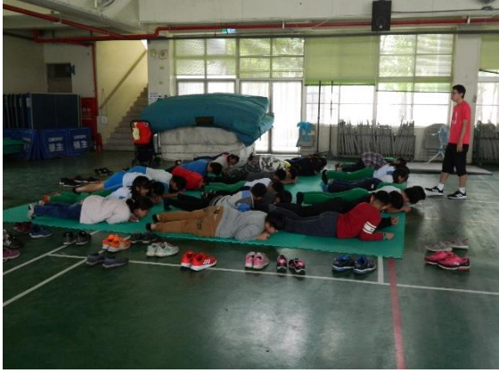
說明：學生參與健康活動