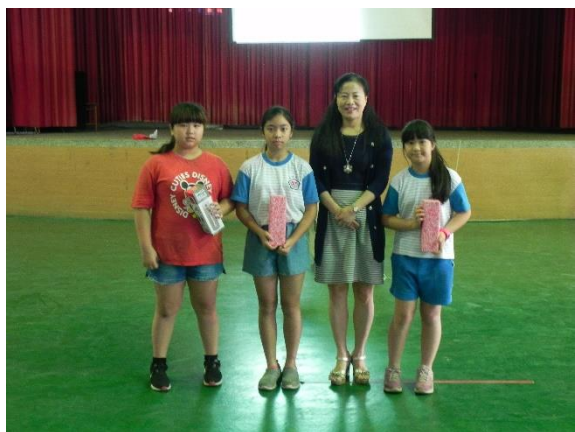
說明：健康體位最佳努力寶貝與校長合照並頒獎