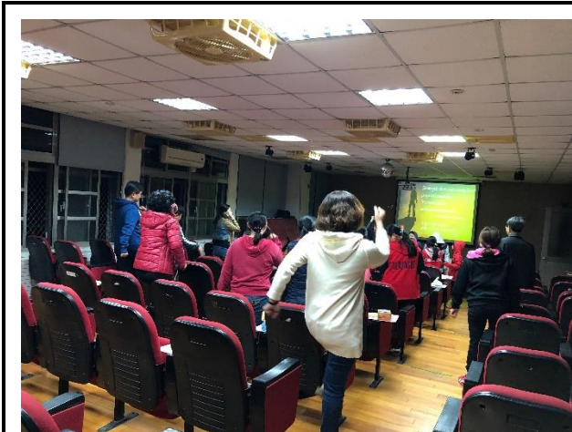
說明：家長和孩子一起動一動