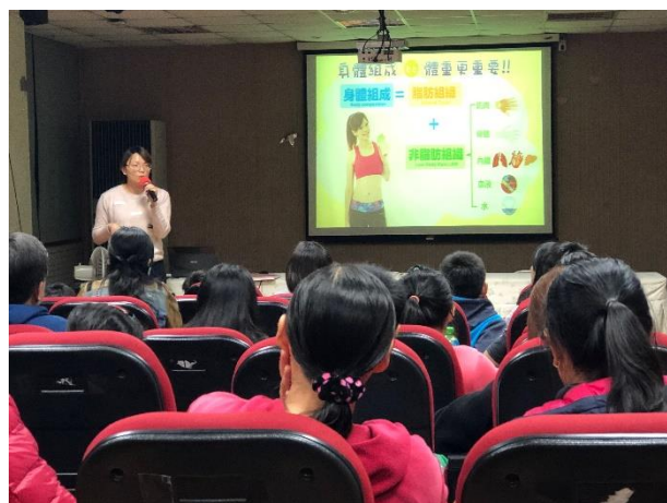
說明：向家長說明身體組成的意義