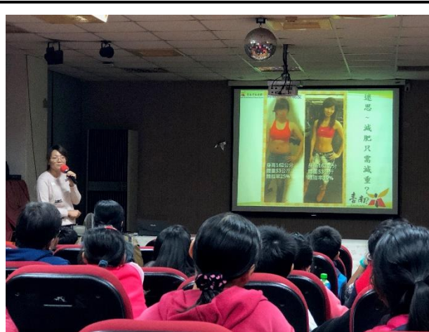
說明：向家長說明健康的身體組成