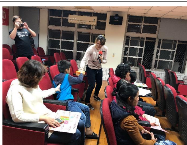
說明：講師與學員互動