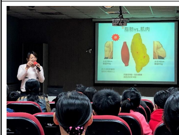
說明：向家長說明脂肪與肌肉的不同