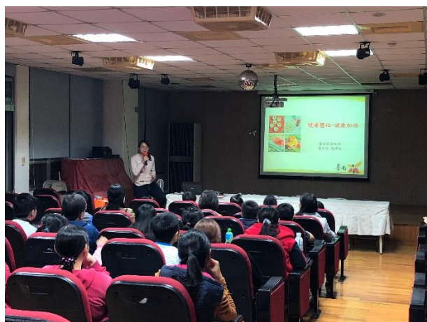
說明：親子講座主題-健康體位、健康加倍