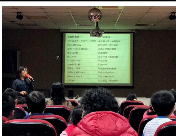
說明：向家長說明如何透過一些替代行為減重