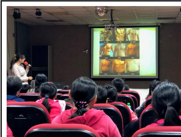
說明：向家長說明健康的身體組成